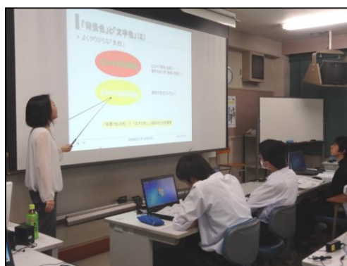
背景色と文字色の相性の説明