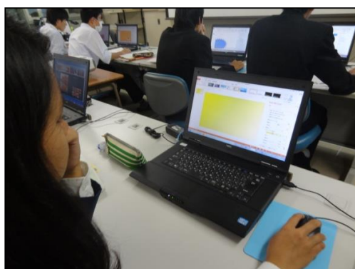
店頭広告制作の様子