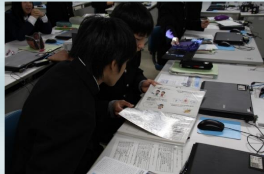
来場者数などの記録を見せていただきました。