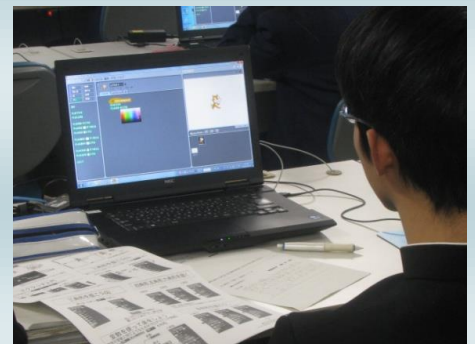
マウスを使ってプログラミング